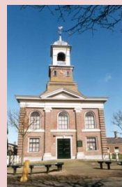
Waddenkerk De Cocksdorp