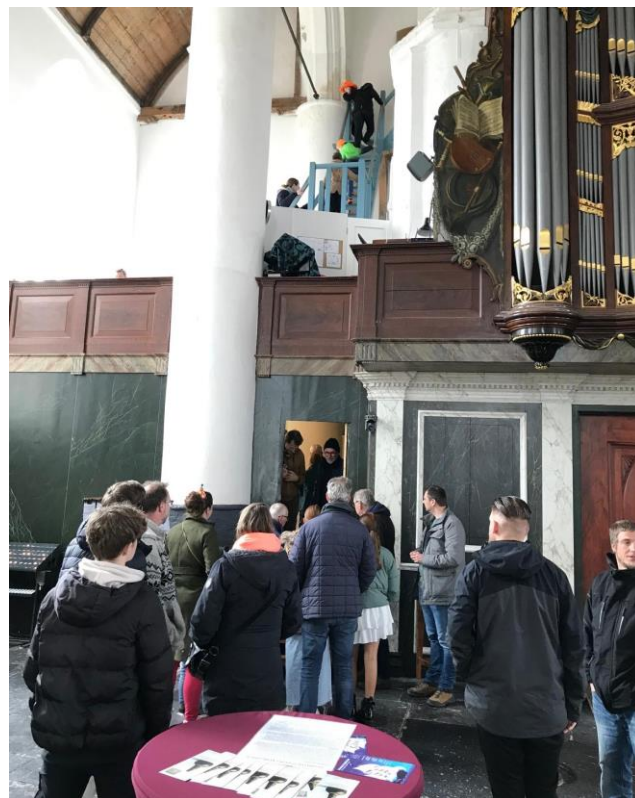
Veel torenklimmers op koningsdag